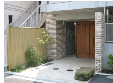
高級感溢れる、エントランス◎