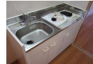
嬉しいシステムガス1口