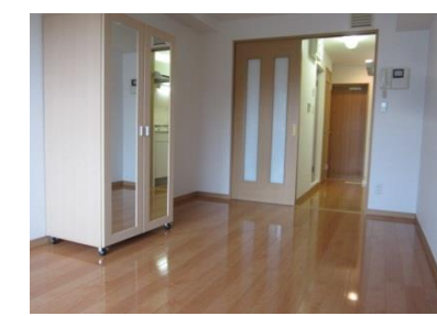
可動式収納で空間使用自由自在