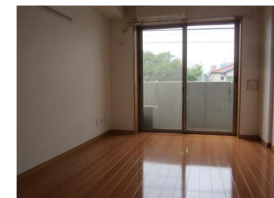
広い居室☆ソファ置けます☆