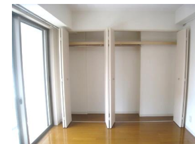
たっぷり入るクローゼット★