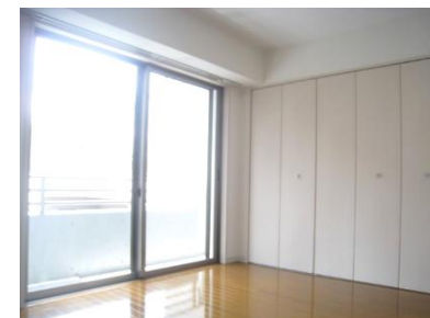
大きい窓で明るいお部屋★