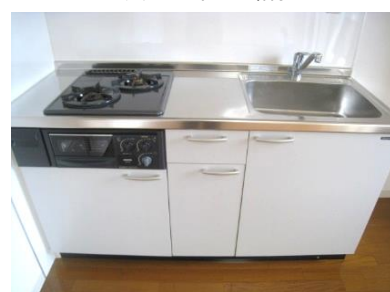
お料理捗るシステムキッチン◆