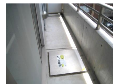
広めのバルコニー(*'▽')