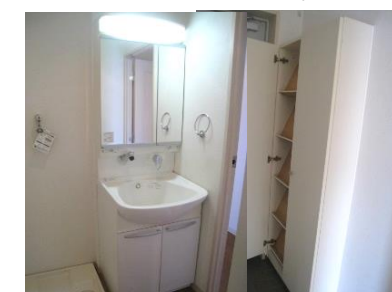
その他設備もバッチリ!